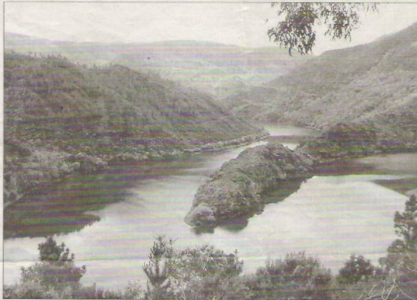
Vista del meandro de A Cubela en el río Sil, desde el Camino Sur de Lugo por la Ribeira Sacra

Los 17 kilómetros que van de Cubela a Monforte de Lemos, por Vilamarín, configuran la tercera etapa. Monforte a Belesar, un trayecto de algo más de 24 kilómetros, conforman la cuarta etapa. El último tramo se hace cruzando el Miño en Belesar y pasando por Chantada; así, llegamos al monte del Faro, un camino de casi 17 kilómetros, que permite en este alto telúrico, centro de devoción, enlazar con el Camino Francés.