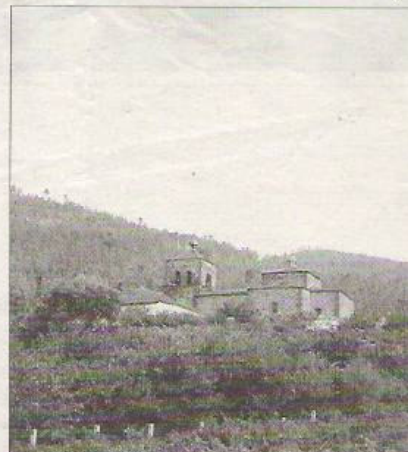
La iglesia de Montefurado en Quiroga