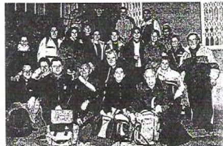
Los peregrinos tienen previsto partir hoy de Portomarín

La numerosa presencia de gente en el trayecto les está llamando poderosamente la atención. «No esperábamos que los albergues estuvieran tan llenos ni encontrarnos a